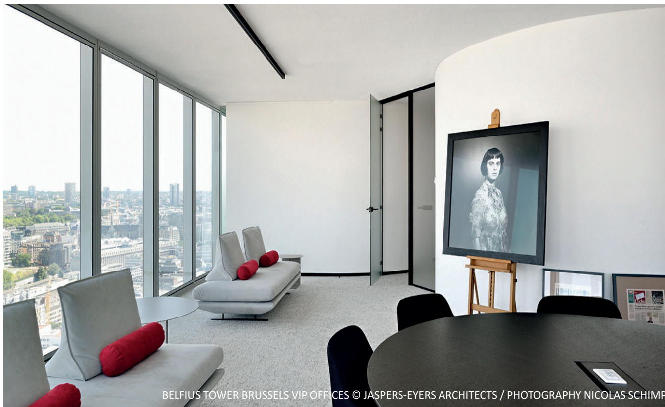
BELFIUS TOWER BRUSSELS VIP OFFICES © JASPERS-EYERS ARCHITECTS / PHOTOGRAPHY NICOLAS SCHIMP